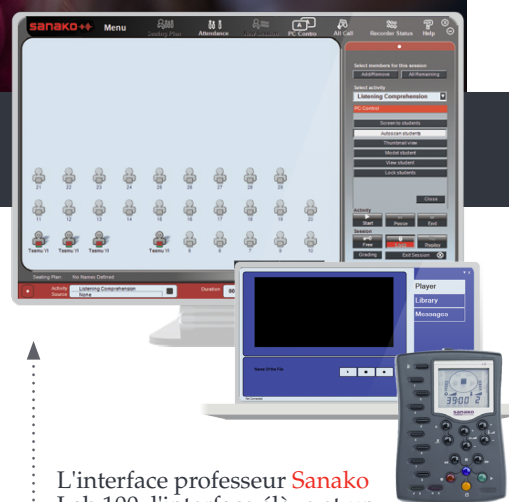
L'interface professeur Sanako Lab 100, l'interface élève et un Panneau Audio Utilisateur

De plus, les élèves peuvent utiliser les outils informatiques, de la simple note aux informations les plus complexes recherchées lors d'une leçon en environnement Lab 100.